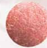
BLOOMING ROSE FM | r004