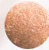
DELICIOUS PAPAYA FM | r003